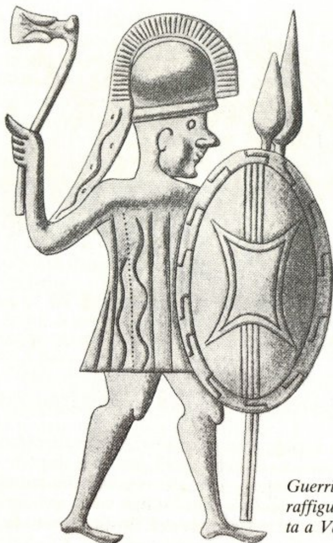
Guerriero hallstatti raffigurato su una fetta a Vače (Slovenia)