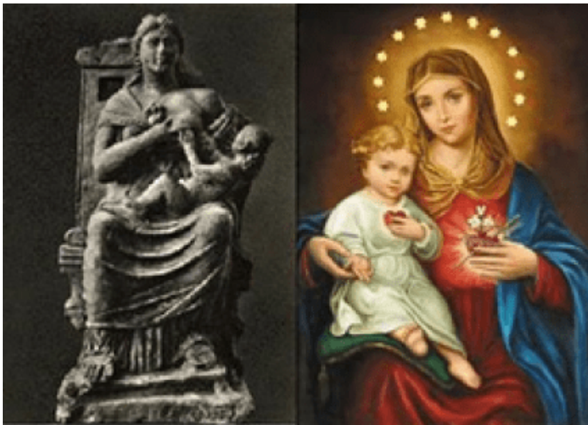
LA DIOSSA BABILONICA SAMIRANIS Y TAMMUZ Y LA VIRGEN MARIA Y EL NIÑO JESUS

PELLINI http://luigi-pellini.blogspot.com/2008/07/la-autobus-che-si-ferma-eleusi.html?fbclid=IwAR0N31V_NaIaBFAr1mFdcrR-mToEYhzBa7dX9m-6coRvUegV-cujY6sV7aA