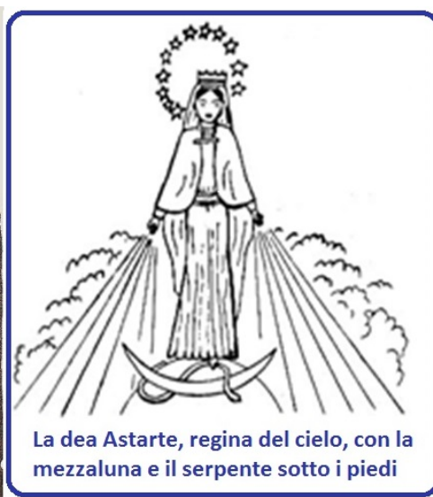
La dea Astarte, regina del cielo, con la mezzaluna e il serpente sotto i piedi