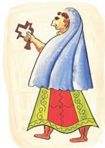
Dea Reitia - da disco bronzeo IV sec. A.C. - Museo Civico Treviso

In effetti, continua Eunapio, divenne poi ierofante un alto iniziato ai Misteri di Mithra (dove rivestiva il ruolo di Pater); questi fu l'ultimo ierofante di Eleusi, perché poco tempo dopo giunsero, attraverso il passo delle Termopili, i Goti di Alarico, seguiti da " uomini in nero " (i monaci cristiani), e il più antico e importante centro religioso d'Europa fu definitivamente distrutto.