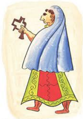
Dea Reitia - da disco bronzeo IV sec. A.C. - Museo Civico Treviso

In effetti, continua Eunapio, divenne poi ierofante un alto iniziato ai Misteri di Mithra (dove rivestiva il ruolo di Pater); questi fu l'ultimo ierofante di Eleusi, perché poco tempo dopo giunsero, attraverso il passo delle Termopili, i Goti di Alarico, seguiti da " uomini in nero " (i monaci cristiani), e il più antico e importante centro religioso d'Europa fu definitivamente distrutto.