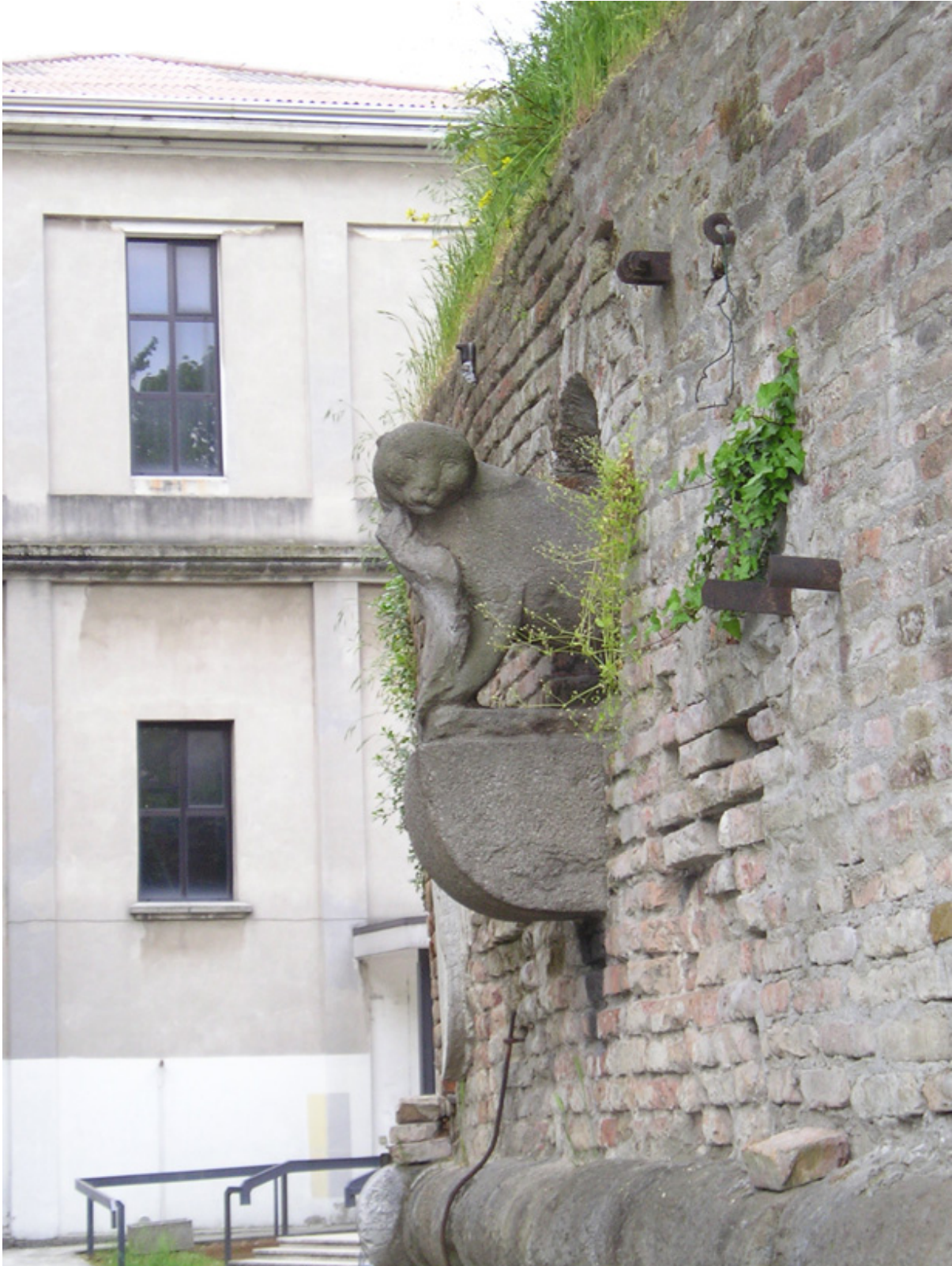
la famosa “gatta”

PADOVA. La rincorsa tra armi d’offesa e armi di difesa è un filo rosso che attraversa tutta la storia umana: ti inventano la daga e la striscia per penetrare le giunture dalla corazza alle ascelle e all’inguine, l’«istrice» degli svizzeri con picche lunghe cinque metri riesce a fermare un attacco di cavalleria con destrieri