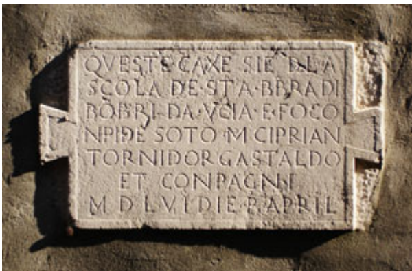
lapide posta sul palazzo con le abitazioni riservate ai bombardieri

Quella di santa Barbara era stata istituita a Venezia nel 1500 pensando soprattutto alle esigenze della marina. Nel 1505 il suo Quartier generale fu trasferito dalla zona di san Marcuola a un pianterreno presso il ponte principale di Campo Santa Maria di Formosa.