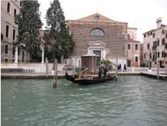
chiesa di san marcuola

Quella di santa Barbara era stata istituita a Venezia nel 1500 pensando soprattutto alle esigenze della marina. Nel 1505 il suo Quartier generale fu trasferito dalla zona di san Marcuola a un pianterreno presso il ponte principale di Campo Santa Maria di Formosa.