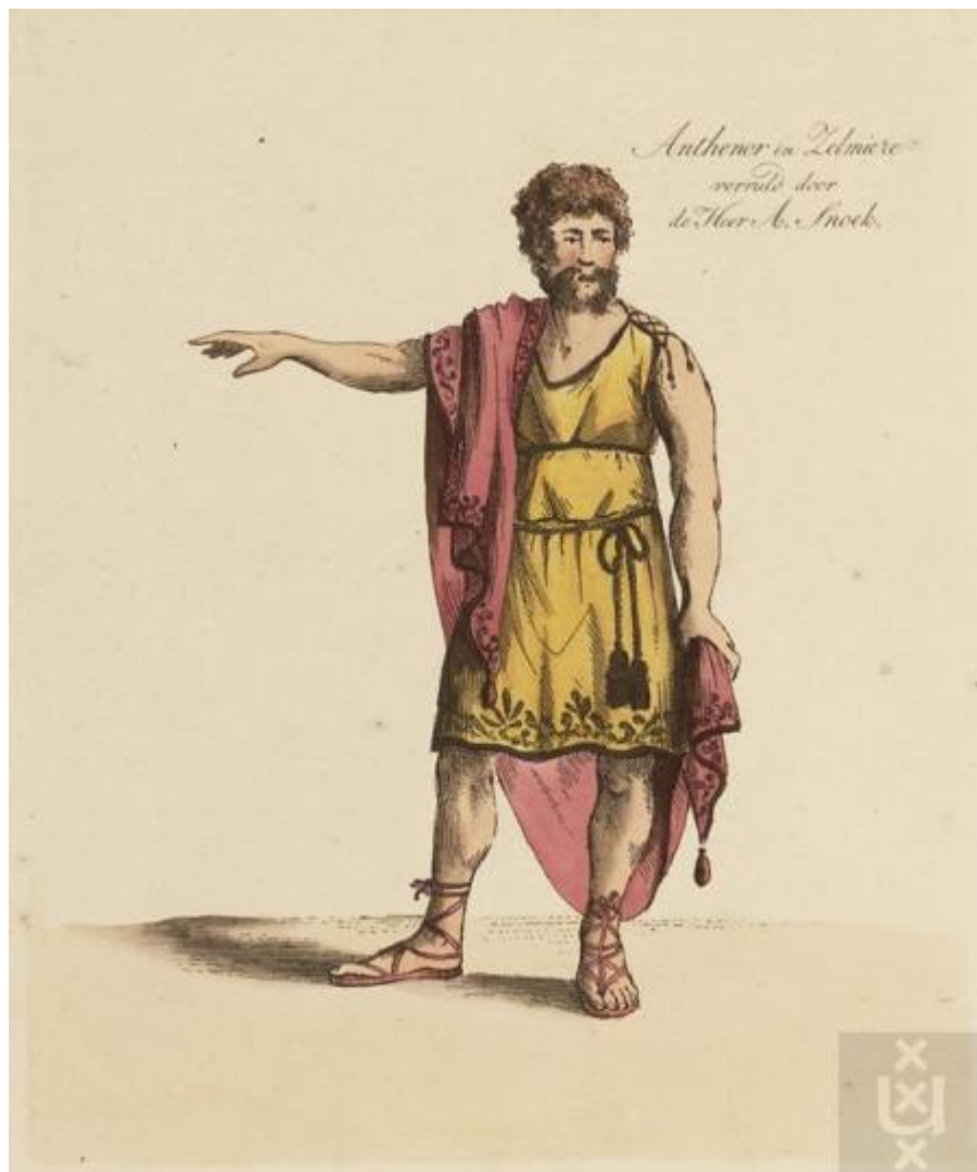
Antenore il mitico fondatore di Padova

Gli antichi Veneti o VENETKENS provenienti dalla anatolica Paflagonia, bagnata dal Mar Nero, chiamavano Venere con gli stessi appellativi destinati alla loro dea Reitia: Retta, Giusta, Nobile, Splendida... E i latini definivano i veneti, per via della stretta parentela della dea dell'amore, amati, benvoluti, associando ad essi anche un colore: l'azzurro. Che era anche il colore identificativo dell'astro.