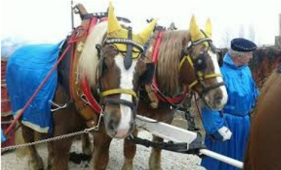
Cavalli e conduttori bardati col colore azzurro dei veneti

Da documenti basso medievali (che ho potuto personalmente esaminare) infatti si parla di una " Domina equorum" ed in seguito " Ma- Donna de li cavali" quindi " Signora dei Cavalli".