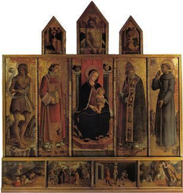
Il Polittico di Massa Fermana , 1468

Si ignorano le ragioni della partenza da Zara e quando l'artista attraversò l'Adriatico. In ogni caso, nel 1468 , firmò il Polittico di Massa Fermana e nel 1469 si trovava già ad Ascoli Piceno , dove aveva già avuto modo di entrare in conflitto con un cittadino per una questione di carattere amministrativo di cui restano tracce documentarie.