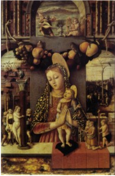
Madonna della Passione

Dopo l'arresto del '57 l'artista era probabilmente finito proprio a Padova, dove doveva aver legato particolarmente con Giorgio Schiavone , seguendolo poi a Zara , città allora sotto il dominio veneziano, in cui lo Schiavone si trovava almeno dal 1461 [5] . Qui Crivelli è citato in due atti notarili del 23 giugno 1463 e dell'11 settembre 1465 , come maestro pittore, cittadino e abitante della città dalmata, ovvero residente da almeno qualche anno.