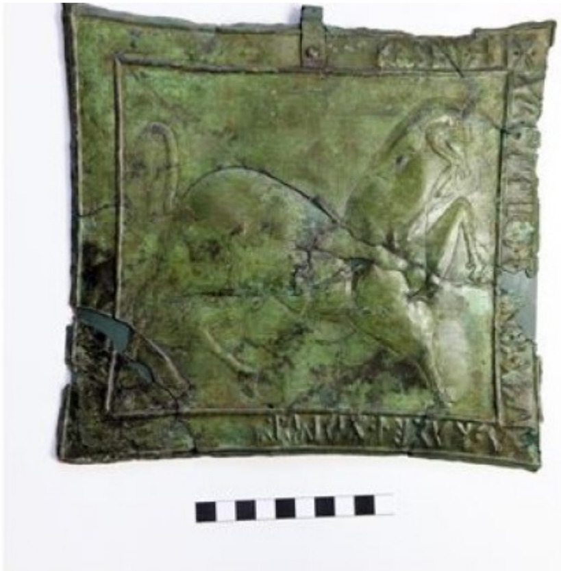
Lamina figurata in bronzo con cavallo, IV – III sec. a.C.