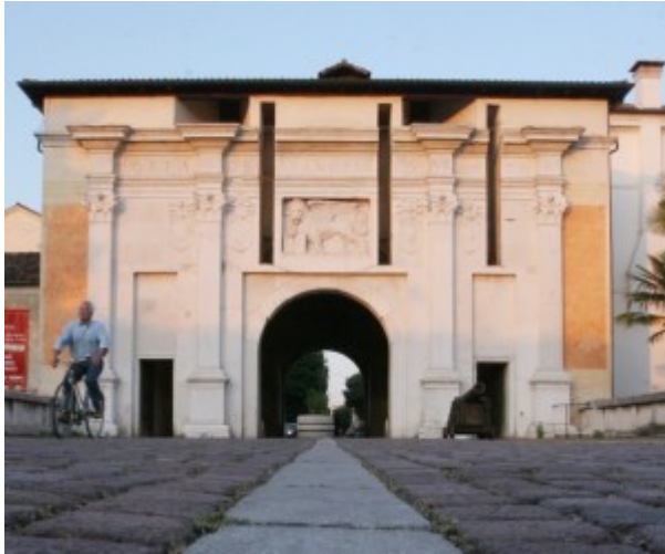
porta SS Quaranta

Sapienza civile e accorgimento politico mostrò Venezia fin dal principio a Treviso.. | 2 secondo il Bonifaccio — perchè essa aveva in Treviso regolato tre cose, che a perfetto principe sono necessarie: Pietà Giustizia e Milizia . Certo è, che con geloso amore vigilò Venezia sulla suddita città vicina, e che con generose cure se la tenne avvinta, pur in quel secolo di guerre di carestie e di pestilenze.