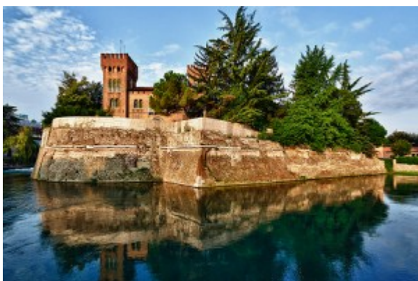
le mura della città

Ben le commetteva ostilità contro i suoi nemici, e la gravava delle spese e dei servizi di guerra; ben le ingiungeva di accogliere sfarzosamente i principi amici che passando si soffermavano; ma pur ne zelava la sicurezza e l'igiene e l'incolumità facendo ricoprir in tegole i coperti di paglia de' suoi borghi, provvedendo perchè si selciassero le piazze e le strade a rendere più salubre l'aria, fornendo grano nelle più terribili distrette e soccorsi ne' contagi ; ma mostravasi disposta a darle miglior parte nel reggimento del territorio con Vicariati commessi a' cittadini, se le insidie e le discordie intestine non avessero attraversato il disegno.